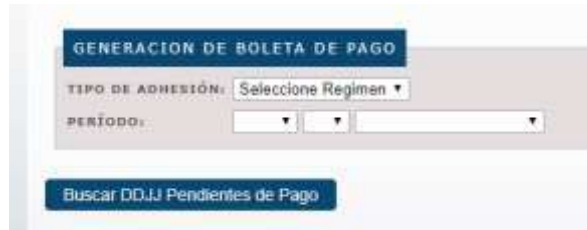
Generación de Boletas de Pago.

Para generar la Boleta de Pago, deberá acceder a la opción del menú indicada con la leyenda Boleta de Pago :