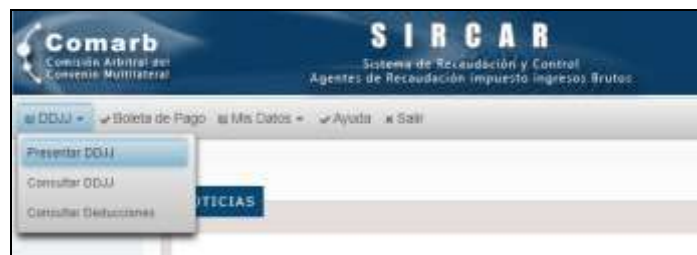
Opción Presentar DDJJ

Para realizar una presentación de Declaraciones Juradas Determinativas, deberá acceder a la opción del menú indicada con la leyenda DDJJ , y luego Presentar DDJJ .