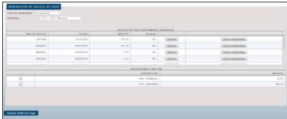
Permite crear una nueva boleta de pago y se muestran las existentes y pendientes de pago.

En el caso que igualmente se verifique necesaria la generación, se debe elegir la o las jurisdicciones a incluir (muestra únicamente las jurisdicciones en las cuales se detecta un saldo a pagar, NO muestra otras jurisdicciones donde se hubiera presentado DDJJ y no de monto a pagar), y luego presionar el botón Generar Boleta de Pago para seguir con el proceso.