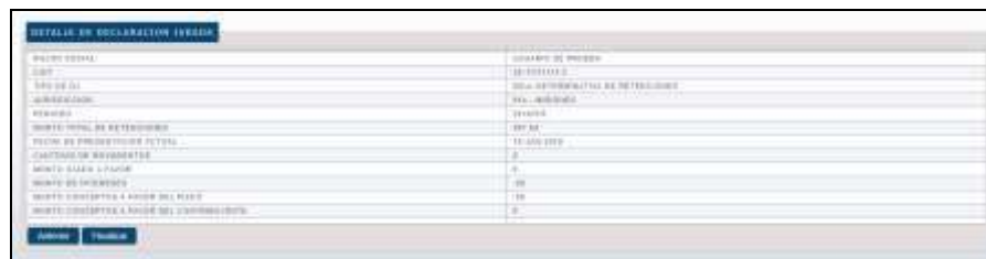
Solicitud de Confirmación de los datos enviados.

Una vez que el Sistema valida que todos los datos ingresados son correctos de acuerdo al archivo con el detalle adjunto, se muestra una pantalla resumen donde se le solicita al Agente la confirmación de la operación que va a realizar.