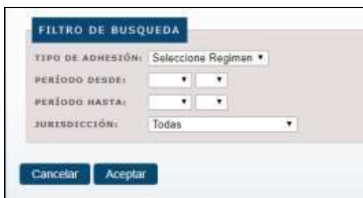
Opciones de búsqueda de DDJJ.

Para ello, deberá acceder a la opción del menú DDJJ , y luego Consultar DDJJ , donde deberá podrá elegir entre diversas opciones para la búsqueda: